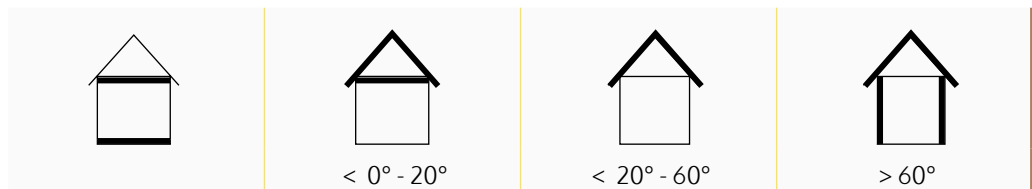
Tabella densità minime